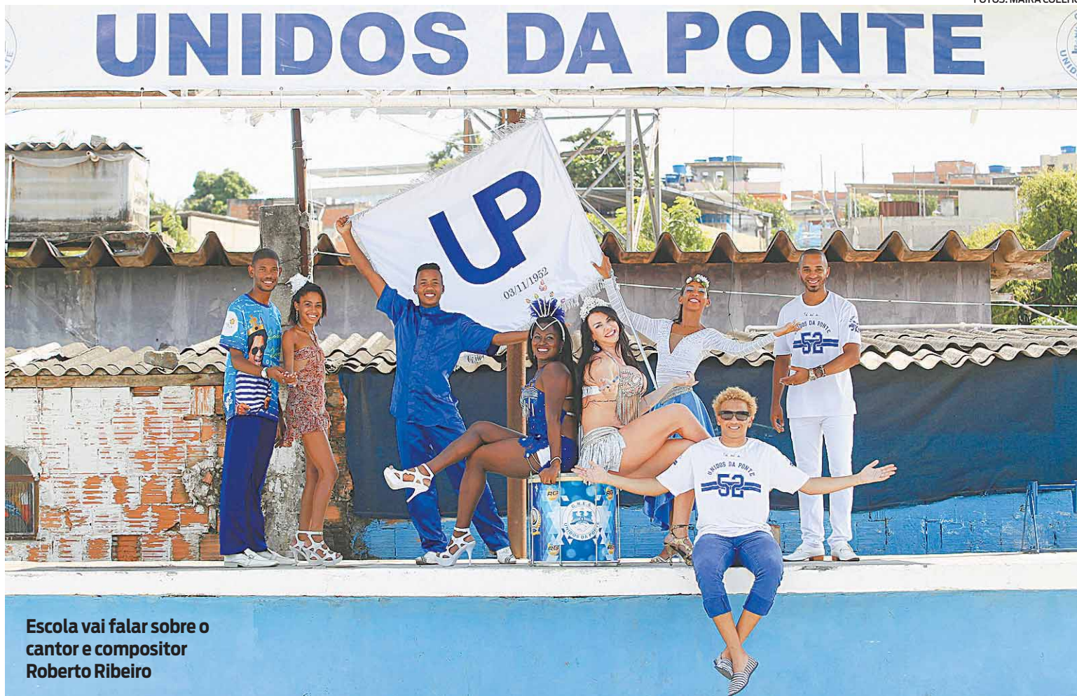
Escola vai falar sobre o cantor e compositor Roberto Ribeiro